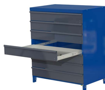
Auszugsregal mit 7 Schubfächern mit Verkleidung (optionales Zubehör)