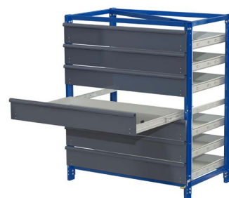
Auszugsregal mit 7 Schubfächern, eines davon voll ausgezogen