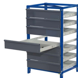
Auszugsregal mit 7 Schubfächern, eines davon voll ausgezogen