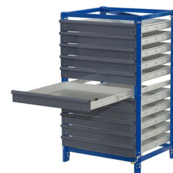
Auszugsregal mit 11 Schubfächern, eines davon voll ausgezogen