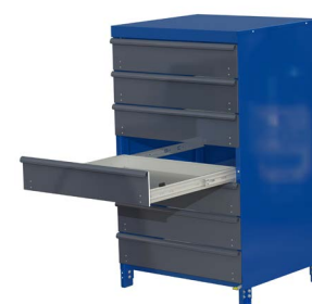
Auszugsregal mit 7 Schubfächern mit Verkleidung (optionales Zubehör)