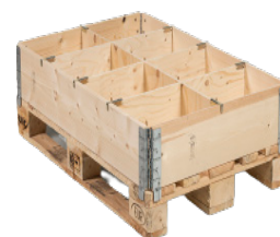
Anwendung: 16 Fächer