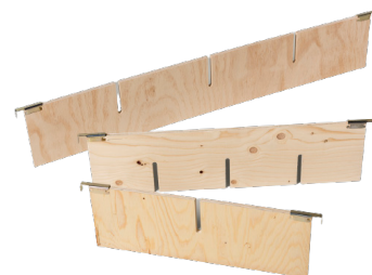
Rahmenteiler in verschiedenen Größen