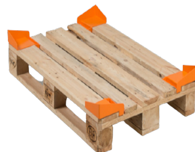
4 Gleitschutzecken auf einer Palette