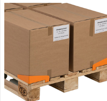
Detail: Gleitschutzecke in Anwendung